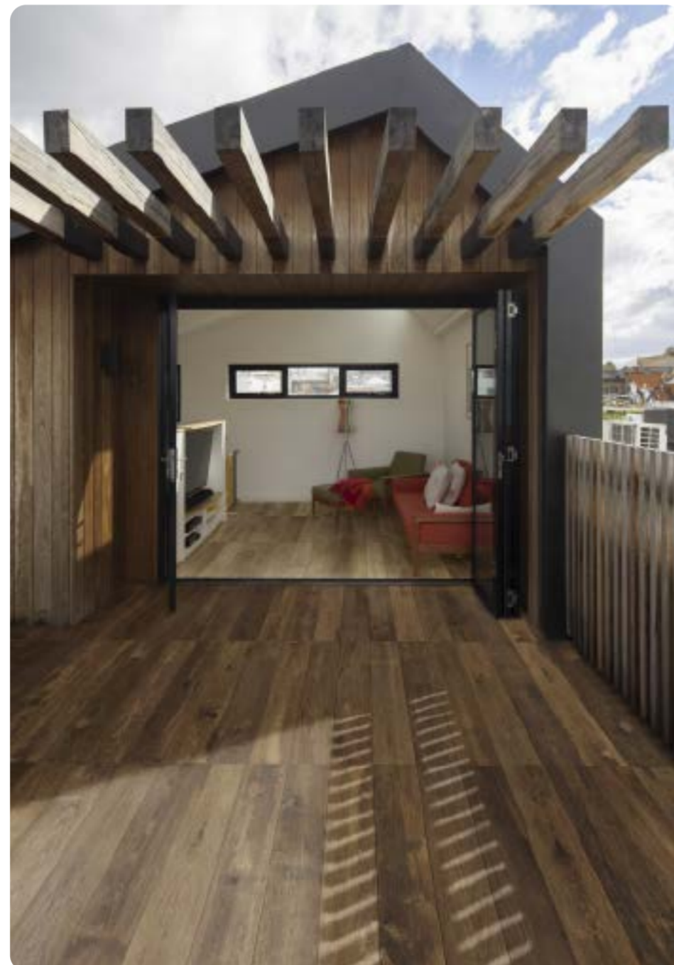
R7GC Marrone Grip rettificato 20x120 - R7FV Beige rettificato 20x120

R7LC XT20 Grigio rettificato 40x120 - R7LH XT20 Grigio rettificato 60x60 - R82W XT20 Grigio Alzata 20x60 - R81W XT20 Grigio Elemento Elle 15x60x4