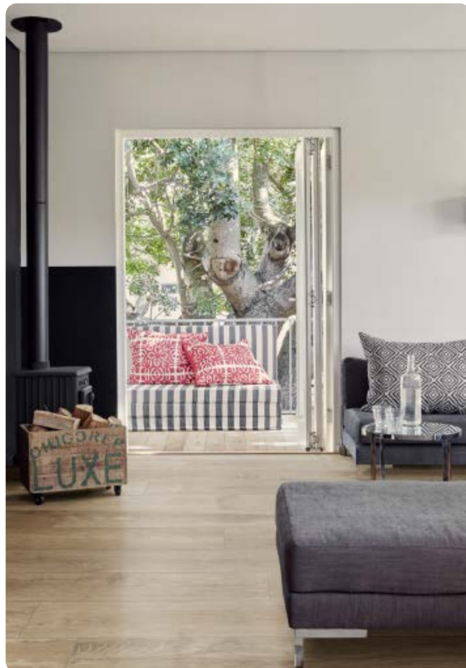
R7EW Beige rettificato 25x150 - R7GA Beige Grip rettificato 20x120