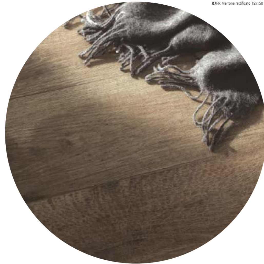
R7FR Marrone rettificato 19x150

Authenticity and performance for outdoor spaces. The anti-slip surfaces, both traditional and 20 mm-thick, make it possible to use Woodsense for external areas or surfaces exposed to high stresses, including with seamless continuity between indoors and outdoors.